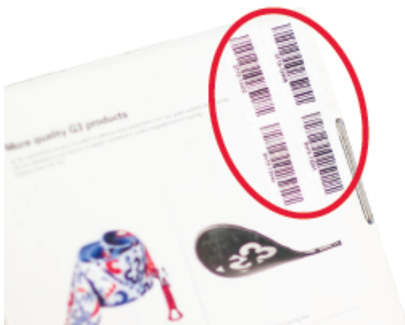
Bottom view of ION packaging box

Pour les fixations neuves encore dans leurs emballages d'origine, vous trouverez les numéros de série sur le dessous des emballages.