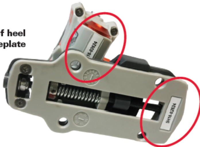
Bottom view of heel turret and baseplate

Vous pouvez identifier les numéros de série selon la photo ci-dessus.